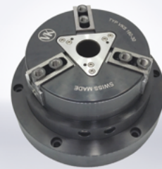
pneumatische Kraftspannfutter stationär oder rotativ einsetzbar

Passende Aufsatzbacken von Schunk sind kompatibel und können in allen Variationen beschafft werden.